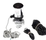
комплект за компенсация по външна температура